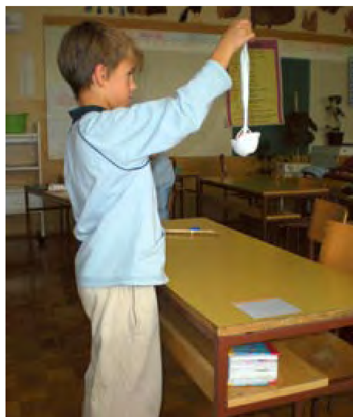
Poskus s čelado in jajcem

Posebno pozornost varnosti v prometu posvečamo tudi pri razrednih urah. Poleg podajanja no-