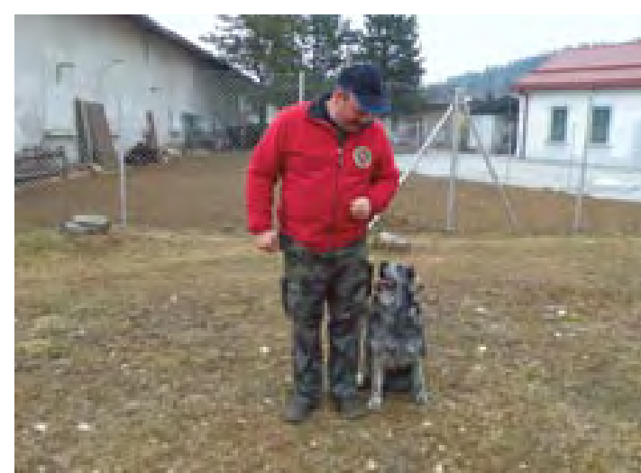
...sklajenost in ...

/Besedilo: Lili Primc/