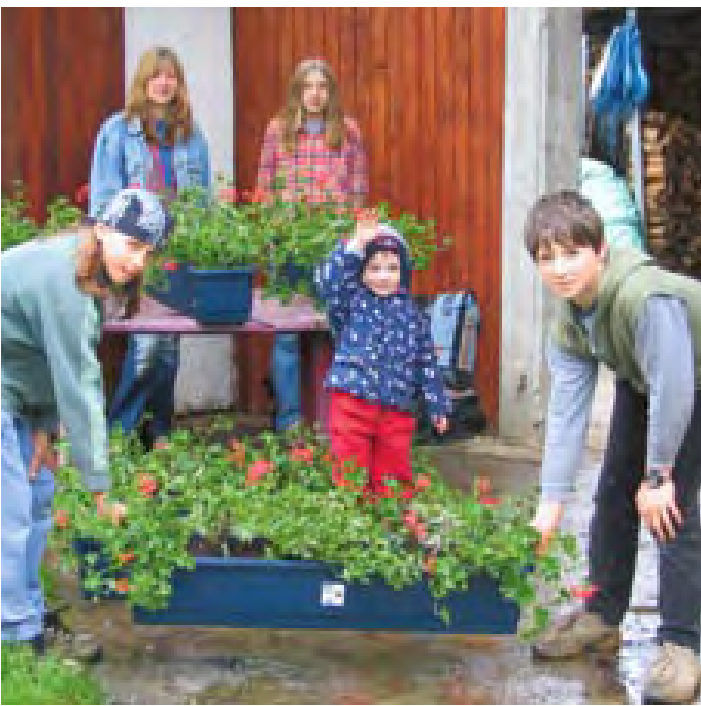
Mladi iz Narina pri sajanju rož.

dan naj se vsaka mati zave, kako je bogata. In to prav zato, ker je mama.« /Sidorija Mozetič, foto: arhiv Dragice Kaluže/