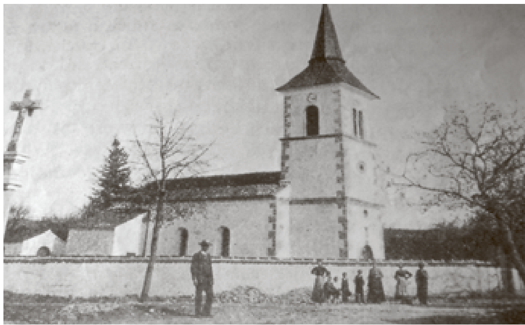
Cerkve sv. Miklavža nekoč...